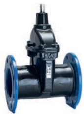
Serie 02/52 Premium 100 Absperrschieber DIN F5 DN40-500 Sphäroguss Äußere PUR- Beschichtung