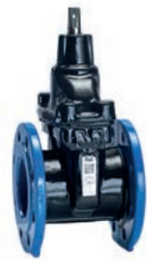
Serie 06/52 Premium 100 Absperrschieber DIN F4 DN40-600 Sphäroguss Äußere PUR- Beschichtung