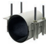
Serie 748/02 Reparaturdichtschellen Zweiteilig Edelstahl AISI 304 oder AISI 316 NBR oder EPDM Gummierung