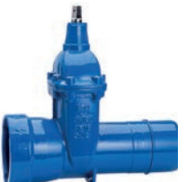
Serie 33/50 Absperrschieber mit BLS® Steckmuffenende/ BLS® Spitzende für Gussrohre DN80-300 PN16 Sphäroguss