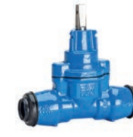
Serie 03/30 Hausanschlussschieber mit Zugmuffen für PE-Rohre DN20-50 PN16 Sphäroguss

Optional: • für seitliches Anstecken mit Innen-/ Außengewinde