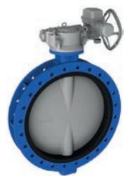
Serie 820/20 Absperrklappe Zentrisch mit austauschbarer Manschette U-Type DN150-1600 PN10/16 Sphäroguss

Optional: • PE100/PN16 • Spindel aus Edelstahl