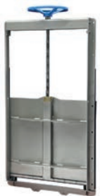
Serie 772/61 Gehäuselose Armaturen aus Edelstahl mit Handrad für Wandmontage DN200-1200

Optional: • Steigende Spindel • Edelstahl/AISI 316