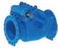
Serie 41/36 Rückschlagklappe Metallisch dichtend Mit Hebel und Gewicht DN350-600 PN10/16 Sphäroguss

Optional: • Hebel und Gewicht • Hebel und Feder • Vorbereitet für Endschalter