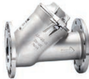
Serie 53/42 Kugelrückschlagventil mit Flanschanschluss DN80-150 PN10 Edelstahl AISI 316