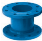
Serie 712 Flanschreduzierstück Sphäroguss