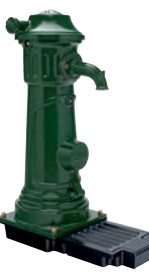
Serie 78/7510 VICTORIA Brunnenpfosten Frostsicher DN40 Grauguss