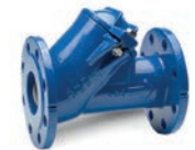
Serie 53/35 Kugelrückschlagventil mit Flanschanschluss DN50-600 PN10 Sphäroguss

Optional: • Externe Epoxid- beschichtung