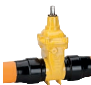
Serie 36/90 Absperrschieber mit PE-Rohrenden DN65-400 PE100/PN10 SDR 11 Sphäroguss Externe Epoxid- beschichtung

Optional: • Druckstoßdämpfung • Belüftungssperre