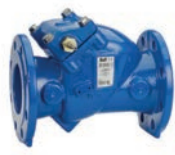
Serie 41/60 Rückschlagklappe Weichdichtend mit freiem Wellenende DN50-300 PN10/16 Sphäroguss

Optional: • Hebel und Gewicht • Hebel und Feder • Vorbereitet für Endschalter