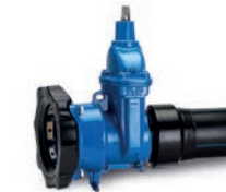
Serie 638 Absperrschieber mit Supa Maxi™/PE-Ende DN80-300