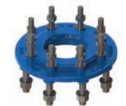
Serie 712 Reduzierflansch Sphäroguss