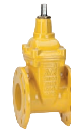
Serie 06/70 Absperrschieber DIN F4 DN40-600 PN10/16 Sphäroguss Externe Epoxid- beschichtung