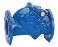
Serie 41/61 Rückschlagklappe Weichdichtend ohne Hebel u. Gewicht DN50-300 PN10/16 Sphäroguss