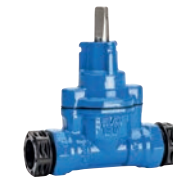
Serie 03/90 Hausanschlussschieber mit PRK-Kupplung für PE-Rohre DN20-50 PN16 Sphäroguss