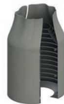
Serie 80/60 Flexdrain Sickerpackung für ÜH/UH DN80/100 Modell Plus L

Optional: • 3" Storz Kupplung • 3" NOR Kupplung • 4" Storz Kupplung