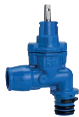
Serie 103/31 Hausanschlusschieber mit Supa Lock™ Muffenende/ zugfester Einsteckmuffe DN32 PN16 Sphäroguss