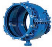
Serie 8001 Hydro Stop Universal Muffenmanschetten aus Kohlenstoffstahl EPDM Gummierung DN250-2000