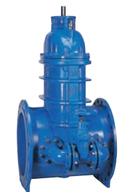
Serie 55/30 Absperrschieber DN450-500-600-800 DIN F5 PN10/16 Sphäroguss Widerstandsfähig sitzend Austauschbare Spindelabdichtung