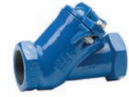
Serie 53/30 Kugelrückschlagventil mit Innengewinde DN32-50 PN10 Sphäroguss