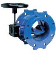
Serie 756/100 Absperrklappe Doppelsexzentrisch Integrierter Sitz IP 67 Getriebe DN150-2800 PN10/16 Sphäroguss

Optional: • Innen emalliert • Sitz aus Edelstahl • IP 68 Getriebe • ISO-Eingangsgetriebe • PN25 in DN150-1200