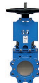
Serie 702/20 Plattenschieber mit Handrad und steigende Spindel DN50-1200 PN10 Sphäroguss

Optional: • Doppelflansch lang • Verschiedene Antriebe