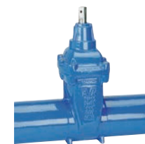
Serie 32/40 Absperrschieber mit langen Spitzenden für Gussrohre DN80-300 PN16 Sphäroguss