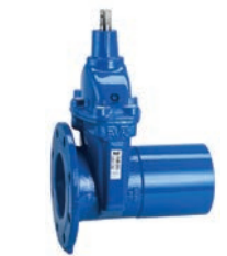
Serie 12/51 Absperrschieber mit Flansch/Spitzende für Gussrohre DN50-300 PN10/16 Sphäroguss