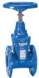
Serie 06/35 Absperrschieber mit Stellanzeiger DIN F4 DN50-400 PN10/16 Sphäroguss