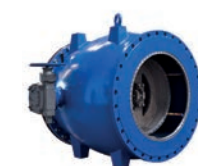
Serie 872 Ringkolbenventil DN 80-1600 PN 10/16/25/40 Edelstahl DN80-150 Sphäroguss ab DN200