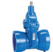
Serie 33/00 Absperrschieber mit Steckmuffenenden für Gussrohre DN80-300 PN16 Sphäroguss Mit Innenemallierung