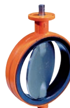
Serie 75/11 Absperrklappe Zentrisch mit aufvulkanisierter Manschette Wafer Type DN50-600 PN10/16 Sphäroguss

Optional: • Semi-Lug Type • Voll Lug Type • Doppelflansch