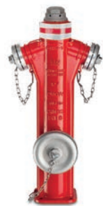
Serie 84/16 P7-Überflurhydranten mit zusätzlicher Kugelabspernung und Sollbruchstelle 2x B- & 1x A-Kupplung DN100 PN16 Sphäroguss

Optional: • Mit 1x A-Kupplung • seitlicher Flansch