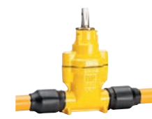
Serie 36/9X Hausanschlusschieber mit PE-Enden DN25-50 PE100/PN10 or 5 Sphäroguss Externe Epoxid- beschichtung