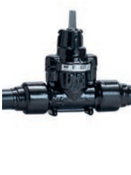
Serie 36/5X Premium 100 Hausanschlussschieber mit PE Enden DN25-50 Sphäroguss Äußere PUR- Beschichtung

Optional: • Doppelflansch lang • verschiedene Antriebe