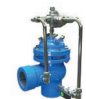
Serie 771/730 Druckentlastungs- und Sicherheitsventil in Schrägsitzausführung DN 65-300 PN16 Sphäroguss