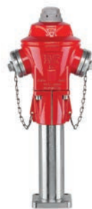
Serie 84/72 P7-NIRO- Überflurhydranten mit zusätzlicher Kugelabspernung und Sollbruchstelle 2x B-Kupplung DN80/100 PN16 Sphäroguss/Edelstahl

Optional: • Ohne A-Kupplung • seitlicher Flansch