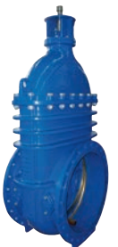
Serie 54 Absperrschieber DN700-800-900 BS PN10/16 Sphäroguss Metallisch Dichtend