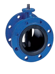
Serie 75/20 Absperrklappe Zentrisch mit aufvulkanisierter Manschette Doppelflansch kurz DN50-2000 PN10/16 Sphäroguss

Optional: • Semi Lug Type • Voll Lug Type • verschiedene Antriebe