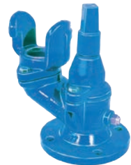
Serie 35/20 Unterflurhydranten für Schacht- und Erdbau Modell 477 Württembergische Norm DN65 PN10/16 Sphäroguss

Optional: • DIN F5 • Hydraulik/Pneumatik Antrieb • Keilgummierung NBR