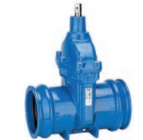
Serie 01/80 Absperrschieber mit „Euro“ Steckmuffenenden für uPVC-Rohre DN40-400 PN16 Sphäroguss