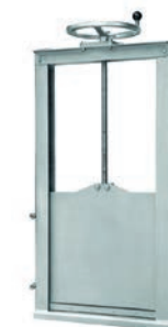
Serie 772/7172 Gehäuselose Armaturen aus Edelstahl mit Handrad für Wandmontage DN200-1500

Optional: • Steigende Spindel • Edelstahl/AISI 316