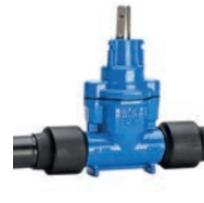
Serie 36/8X Hausanschlussschieber mit PE Enden DN25-50 PE100/PN10 Sphäroguss

Optional: • PE100/PN16 • Spindel aus Edelstahl