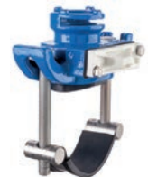
Serie 100/85 Anbohrarmatur mit Klappenabsperung für Gusseisen- und Stahlrohre Ø 50-360 mm DN32 Sphäroguss/ Edelstahl