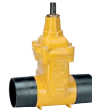
Serie 46/64 Absperrschieber mit kurzen Schweißenden für Stahlrohr DN50-300 PN16 Stahlguss GP240GH Externe Epoxid- beschichtung