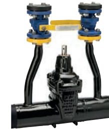
Serie 46/80 Absperrschieber mit langen Schweißenden für Stahlrohr und zwei Entleerungspunkten DN80-600 PN16 Stahlguss GP240GH Externe PUR Beschichtung

Optional: • Externe Epoxid- beschichtung • ISO-Spindel für Antrieb