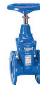
Serie 06/35 Absperrschieber mit Stellungsanzeiger DIN F4 DN50-400 PN10/16 Keilgummierung EPDM Sphäroguss