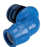
Serie 107/31 90° Adapter für PE-Rohre Ø 32-63 mm DN32 Sphäroguss