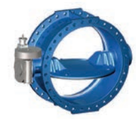
Serie 756/102 Absperrklappe Doppelsexzentrisch Sitz aus Edelstahl ISO-Eingangsgetriebe DN150-2800 PN10/16 Sphäroguss

Optional: • Innen emalliert • Sitz aus Edelstahl • IP 68 Getriebe • ISO-Eingangsgetriebe • PN25 in DN150-1200