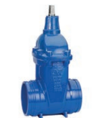
Serie 06/38 Absperrschieber mit geriffelten Enden DN50-300 PN16 Sphäroguss