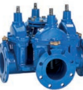
Serie 18/70 Kombi-Schieberkrenz mit 4 Anschlüssen DN100-300 PN10/16 Sphäroguss