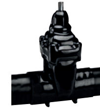
Serie 46/70 Absperrschieber mit langen Schweißenden für Stahlrohr DN50-600 PN16 Stahlguss GP240GH Externe PUR Beschichtung

Optional: • Externe Epoxid- beschichtung • ISO-Spindel für Antrieb