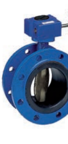
Serie 75/20 Absperrklappe Zentrisch mit aufvulkanisierter Manschette Doppelflansch kurz DN50-2000 PN10/16 Sphäroguss

Optional: • Voll Lug type • Verschiedene Antriebe