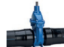
Serie 36/84 Absperrschieber mit PE 100-Rohrstutzen DN65-300 PN16 SDR11 Sphäroguss