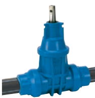
Serie 16/80 Hausanschlussschieber mit PE Enden DN25-50 PE100/PN16 POM (Polyoxymethylene)

Optional: • Integrierter Sitz • IP 67 Getriebe • IP 68 Getriebe • PN25 in DN150-1200