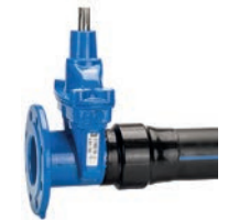
Serie 38/80 Absperrschieber mit Flanschanschluss und PE Ende DN50-200