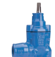
Serie 11/30 Hausanschlussschieber mit senkrechtem Außengewinde und Zugmuffen für PE-Rohre DN25-50 PN16 Sphäroguss

Optional: • PRK Kupplung/ Außengewinde • T-Haube • Spindel aus Edelstahl