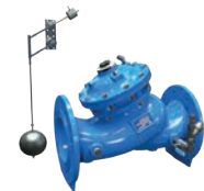
Serie 771/750-66-I Niveauregulierungsventil mit Schwimmer und Zweipunktsteuerung DN 65-300 PN16 Sphäroguss