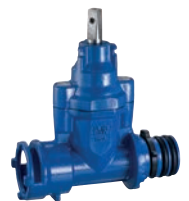
Serie 103/00 Hausanschlusschieber mit Supa Lock™ Muffenende/ Steckende DN32 PN16 Sphäroguss