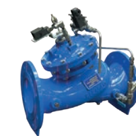
Serie 771/740-S Regelventil für Druckerhöhungspumpen DN 65-300 PN16 Sphäroguss