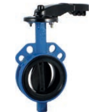
Serie 820/00 Absperrklappe Zentrisch mit austauschbarer Manschette Wafer Type DN25-1000 PN10/16 Sphäroguss