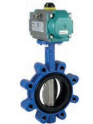
Serie 820/10 Absperrklappe Zentrisch mit austauschbarer Manschette Lug Type DN25-600 PN10/16 Sphäroguss