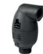
Serie 771/C30 Be- und Entlüftungsventile mit Dreifachfunktion DN 20-80 PN16 Kunststoff