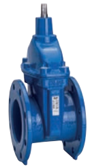
Serie 06/30 Absperrschieber DIN F4 DN40-1000 PN10/16 Sphäroguss