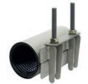
Serie 748/01 Reparaturdichtschellen Einteilig Edelstahl AISI 304 oder AISI 316 NBR oder EPDM Gummierung