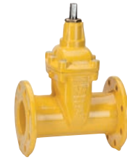
Serie 02/70 Absperrschieber DIN F5 DN40-500 PN10/16 Sphäroguss Externe Epoxid- beschichtung