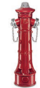
Serie 84/45 P7-NOSTALGIE- Überflurhydranten mit zusätzlicher Kugelabspernung und Sollbruchstelle 2x B-Kupplung DN80 PN16 Sphäroguss

Optional: • Ohne A-Kupplung • seitlicher Flansch