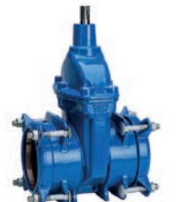
Serie 01/70 Supa Plus™ Absperrschieber mit Zugkupplungsenden für PE- und uPVC-Rohre DN40-300 PN16 Sphäroguss