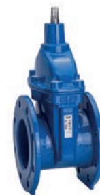
Serie 06/44 Absperrschieber DIN F4 DN40-400 PN10/16 Keilgummierung NBR Sphäroguss

Optional: • Sitz aus Edelstahl • Rückflussverhinderer