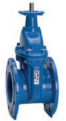
Serie 15/42 Absperrschieber mit ISO-Spindel für Antrieb DIN F4 DN40-400 PN10/16 Sphäroguss