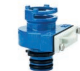
Serie 107/74 Anbohrarmatur mit Klappenabsperung DN32 Sphäroguss