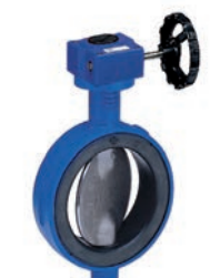
Serie 75/10 Absperrklappe Zentrisch mit austauschbarer Manschette Wafer Type DN40-1400 PN10/16 Sphäroguss

Optional: • Semi Lug Type • Voll Lug Type • verschiedene Antriebe