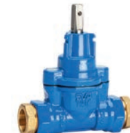
Serie 03/65 Hausanschlussschieber mit zugfesten Schraubkupplungen für PE-Druckrohre DN25-50 PN16 Sphäroguss

Optional: • für seitliches Anstecken mit Innen-/ Außengewinde