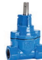
Serie 03/00 Hausanschlussschieber mit BSP-Innengewinde DN25-50 PN16 Sphäroguss