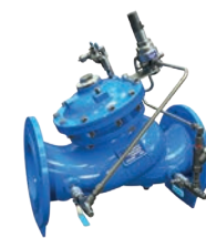
Serie 771/720-IV ES Einstufiges Druckreduzierventil mit V-Port DN 65-300 PN16 Sphäroguss