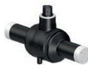
Serie 85/50 PE100 Kugelhahn DN25-150 PN10-16