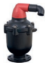
Serie 771-C50 Be- und Entlüftungs- ventile DN 50-100 PN16 Glasfaserverstärktes Nylon

Optional: • Druckstoßdämpfung • Belüftungssperre