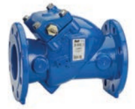
Serie 41/60 Rückschlagklappe Federnder Sitz Freie Welle DN50-300 PN10/16 Sphäroguss

Optional: • Hebel und Gewicht • Hebel und Feder • Geschlossene Buchsen • Vorbereitet für Endschalter