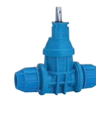
Serie 16/59 Hausanschlussschieber mit Pentomech™ Anschlüsse DN25-50 PN16 POM (Polyoxymethylene)

Optional: • Außengewinde/ Steckmuffenende • T-Haube