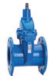
Serie 02/20 Absperrschieber BS DN50-400 PN10/16 Sphäroguss