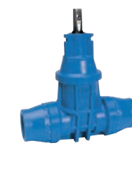
Serie 16/50 Hausanschlussschieber mit Zugmuffen für PE-Rohre DN25-50 PN16 POM (Polyoxymethylene)

Optional: • Außengewinde/ Steckmuffenende • T-Haube