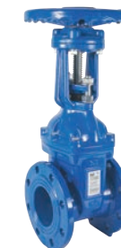
Serie 06/89 Absperrschieber mit steigende Spindel DIN F4 DN50-400 PN10/16 Sphäroguss

Optional: • Magnetventilsatz und Näherungsschalter