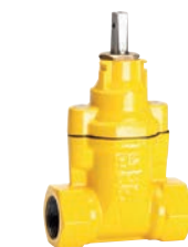
Serie 03/25 Hausanschlusschieber mit Innengewinde DN25-50 PN4 Sphäroguss Externe Epoxid- beschichtung

Optional: • Steigende Spindel • Edelstahl/AISI 316