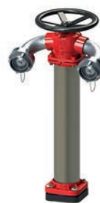
Serie 84/93 N7-Tunnelhydrant Überflurhydranten mit Sollbruchstelle DN80 PN16 Edelstahl

Optional: • Mit A-Kupplung • seitlicher Flansch