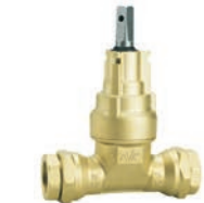
Serie 16/05 Hausanschlussschieber mit Schraubkupplungen für PE-Rohre DN25-50 PN16 Messing