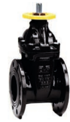
Serie 15/78 Absperrschieber mit ISO-Spindel für Antrieb DN50-400 PN10/16 Sphäroguss Externe PUR Beschichtung

Optional: • Externe Epoxid- beschichtung