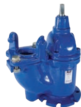
Serie 29/40 Unterflurhydranten mit Bajonettverschluss DN100 PN16 Sphäroguss

Optional: • 3" Storz Kupplung • 3" NOR Kupplung • 4" Storz Kupplung