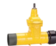
Serie 46/90 Absperrschieber mit Schweißenden/PE Enden DN50-300 PN10 Stahlguss GP240GH Externe Epoxid- beschichtung

Optional: • PE100/PN10/5 • Flansch/PE Ende • ISO-Spindel für Antrieb • Externe PUR Beschichtung