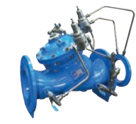
Serie 771/772-IUV Druckflusskontrollventil und Druckreduzierventil DN 65-300 PN16 Sphäroguss