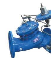
Serie 771/750-80-M6 Niveauregulierungsventil mit Höhenpilot und Einpunktsteuerung DN 65-300 PN16 Sphäroguss