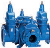
Serie 18/01 Kombi-Schieberkrenz flexibles Design DN100-400 PN10/16 Sphäroguss