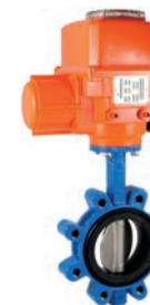
Serie 820/10 Absperrklappe Zentrisch mit austauschbarer Manschette Lug Type DN25-600 PN10/16 Sphäroguss

Optional: • Für häufigen Einsatz • Verschiedene Antriebe