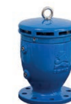
Serie 771/C70-C-M Be- und Entlüftungsventile mit Dreifachfunktion DN 50-250 PN16, PN25 & PN40 Sphäroguss