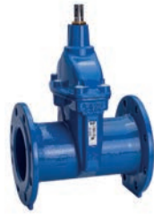
Serie 02/75 Absperrschieber DIN F5 Austauschbare Spindelabdichtung DN40-500 PN10/16 Sphäroguss