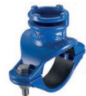
Serie 100/14 Anbohrarmatur für Gusseisen- und Stahlrohre Ø 60-223 mm DN32 Sphäroguss