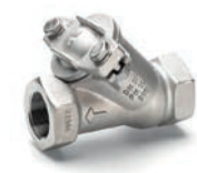
Serie 53/30 Kugelrückschlagventil mit Innengewinde DN32-80 PN10 Edelstahl AISI 316