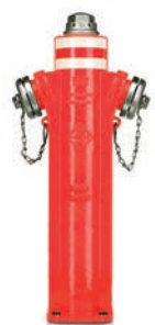
Serie 84/00-12 P5-Überflurhydranten mit zusätzlicher Kugelabspernung und Sollbruchstelle 2x B-Kupplung DN80/100 PN16 Sphäroguss

Optional: • Mit 1x A-Kupplung • seitlicher Flansch