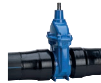
Serie 36/80 Absperrschieber mit PE Enden DN65-500