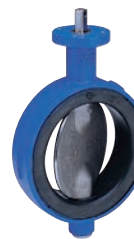
Serie 75/10 Absperrklappe Zentrisch mit aufvulkanisierter Manschette Wafer Type DN40-1400 PN10/16 Sphäroguss

Optional: • Für häufigen Einsatz • U-förmiges Profil • Verschiedene Antriebe