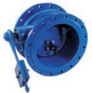
Serie 875 Schrägsitz-Kipp- Rückschlagklappe DN200-1000 PN10/16 Sphäroguss

Optional: • Zugschraubkupplung für PE-Rohre/ Außengewinde