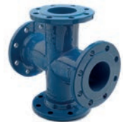
Serie 712 Flanschkreuz Sphäroguss