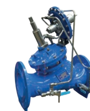
Serie 771/790-M Rohrbruchkontrollventil DN 65-300 PN16 Sphäroguss