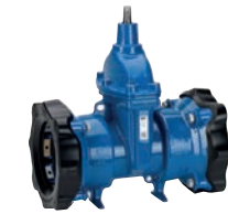
Serie 636 Supa Maxi™ Absperrschieber Universal- und Zugkupplungsenden für alle Rohrarten DN80-300 PN16 Sphäroguss