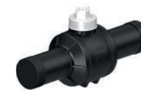
Serie 85/30 Kugelhahn mit Muffensteckenden DN25/Ø20 mm - DN150/Ø180 mm PN10 PE100