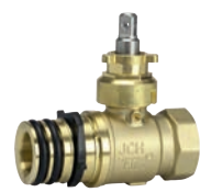
Serie 343/81 Kugelhahn mit Supa Lock™ Muffenende/BSP Innengewinde 1"-1½" DN32, PN16 Messing