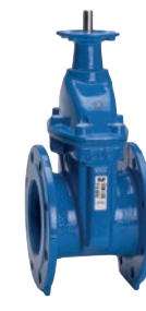
Serie 15/42 Absperrschieber mit ISO-Spindel für Antrieb DIN F4 DN40-400 PN10/16 Sphäroguss

Optional: • DIN F5 • Hydraulik/Pneumatik Antrieb • Keilgummierung NBR