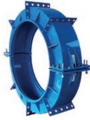
Serie 8002 Hydro Fast Spezial Muffenmanschetten aus Kohlenstoffstahl EPDM Gummierung DN300-2000