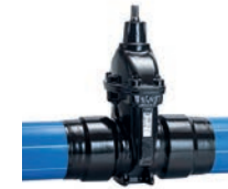
Serie 36/52 Premium 100 Absperrschieber mit PE Enden DN65-400