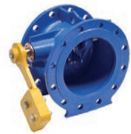
Serie 874 Kipp-Rückschlagklappe Mit Hebel und Gewicht DN150-1600 PN10/16 Sphäroguss