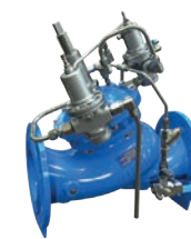
Serie 771/735-M Druckstoßverhinderungsventil DN 65-300 PN16 Sphäroguss