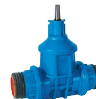
Serie 16/90 Hausanschlussschieber mit PRK-Kupplung DN25-50 PN16 POM (Polyoxymethylene)

Optional: • T-Haube • Spindel aus Edelstahl