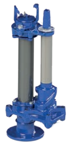
Serie 29/78 F7-Freistrom Unterflurhydranten mit einfacher Absperrung DN80 PN16 750-1500 mm Sphäroguss