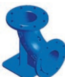
Serie 712 Flanschen-Fußkrümmer (N-Stücke) Sphäroguss