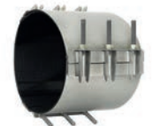
Serie 748/03 Reparaturdichtschellen Dreiteilig Edelstahl AISI 304 oder AISI 316 NBR oder EPDM Gummierung